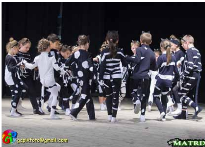
A gála megmozgatta iskolánk és óvodánk apraját-nagyját