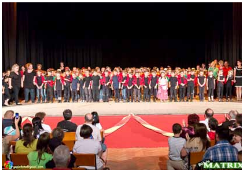
A Kulturális Központ nagyterme zsúfolásig megtelt

2014. június 6-án, pénteken rendezte meg a Szegedi Kis István Református Gimnázium, Általános Iskola, Óvoda és Kollégium a hagyományos suligáláját.