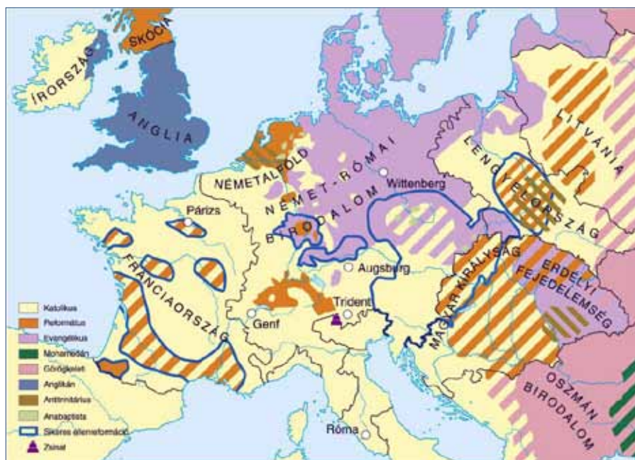
A reformáció nyomán Európa vallásilag sokszínűvé vált

likánok ráadásul erős folytonosságtudattal rendelkeztek a középkori katolikus egyházzal, és templomaik, papjaik ruhái, szertartásaik sem változtak olyan radikálisan, mint a reformátusoké. A reformátusok reformációja sokkal radikálisabb volt, így száz év elteltével a reformátusok teljesen idegenkedve lépték át egy katolikus templom küszöbét. A Kálvin nyomdokain járó reformátusok teljesen lecupasztották megörökölt templomaikat, az új templomok, imaházak, gyülekezeti termek pedig már a puritán egyszerűség jegyében épültek. A hívek csak figyeljenek az igehirdetésre, a képek használata pedig amúgy is írás-ellenes. Különös érzés belépni egy-egy ilyen reformátussá vált középkori gótikus templomba, amelyben a padok mellett csak szószéket, úrasztalát, keresztelőmedencét találunk.