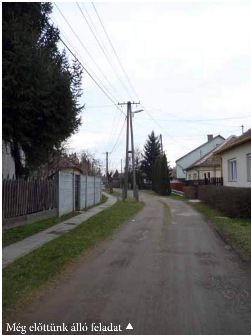
Még előttünk álló feladat ▲