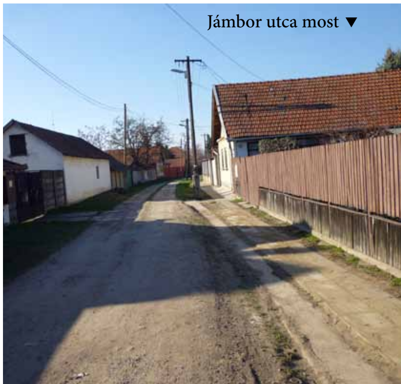
Jámber utca most ▼

Március 17-én a közmunkások kiszélesítették a Jámber utca egysoros járdáját. A közlekedés kényelmesebb és biztonságosabb. Köszönjük a szakszerű munkát!