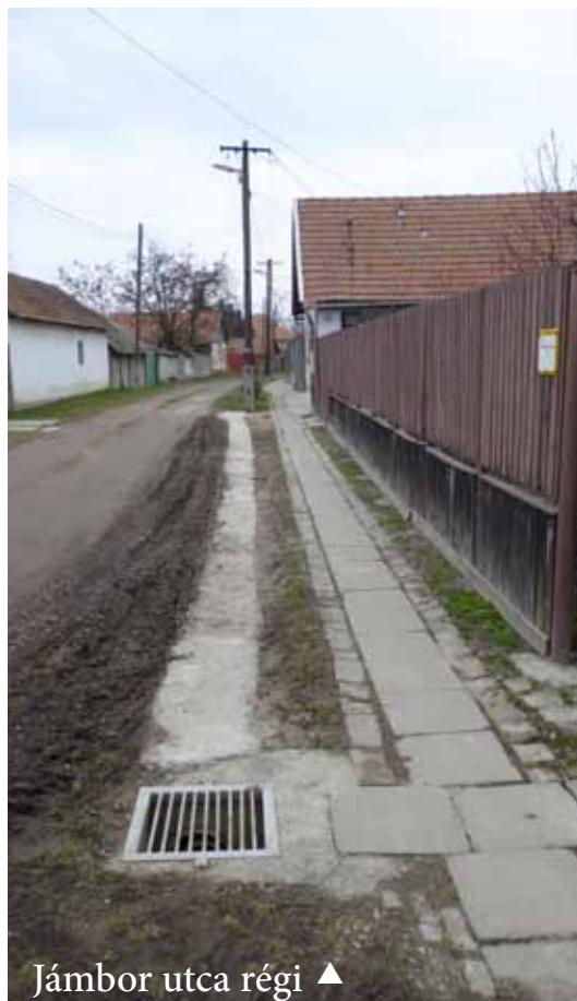
Jámber utca régi ▲

Március 17-én a közmunkások kiszélesítették a Jámber utca egysoros járdáját. A közlekedés kényelmesebb és biztonságosabb. Köszönjük a szakszerű munkát!