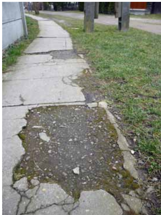
▲ A Kürt utcáról lakossági megkeresést kaptam a járda javítására.