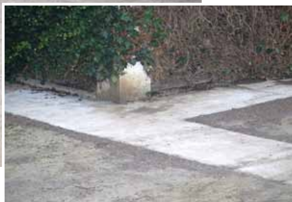
A Kispince utca régi, zezugos utca. Az egyik mellékutca úttestét a lakók kérésére még októberben megcsináltattam.