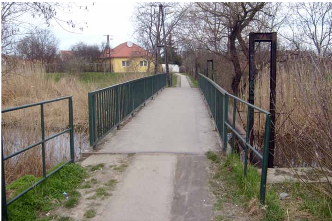
Nem felejtettem el az ibrányi Jámbor utcai hidat. Forgalmas útvonalról van szó. Dolgozunk annak lehetőségén, hogy miként lehet a járdát kiszélesíteni, a sáros szakaszokat felszámolni.