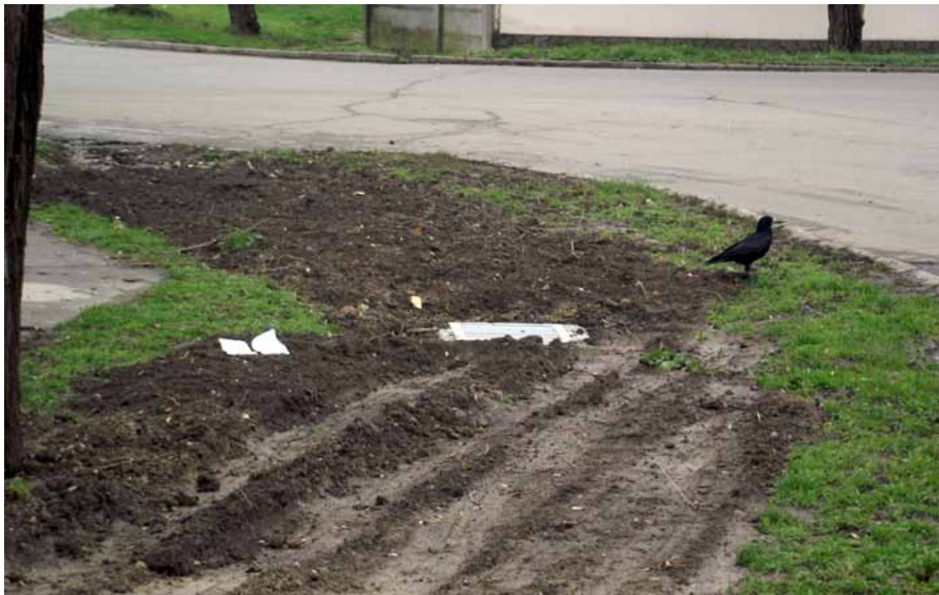
A Bocskai utcai adventista imaház előtti belvízelvezető árok új csövet kapott, és fedetté varázsolták a Polgármesteri Hivatal munkatársai.