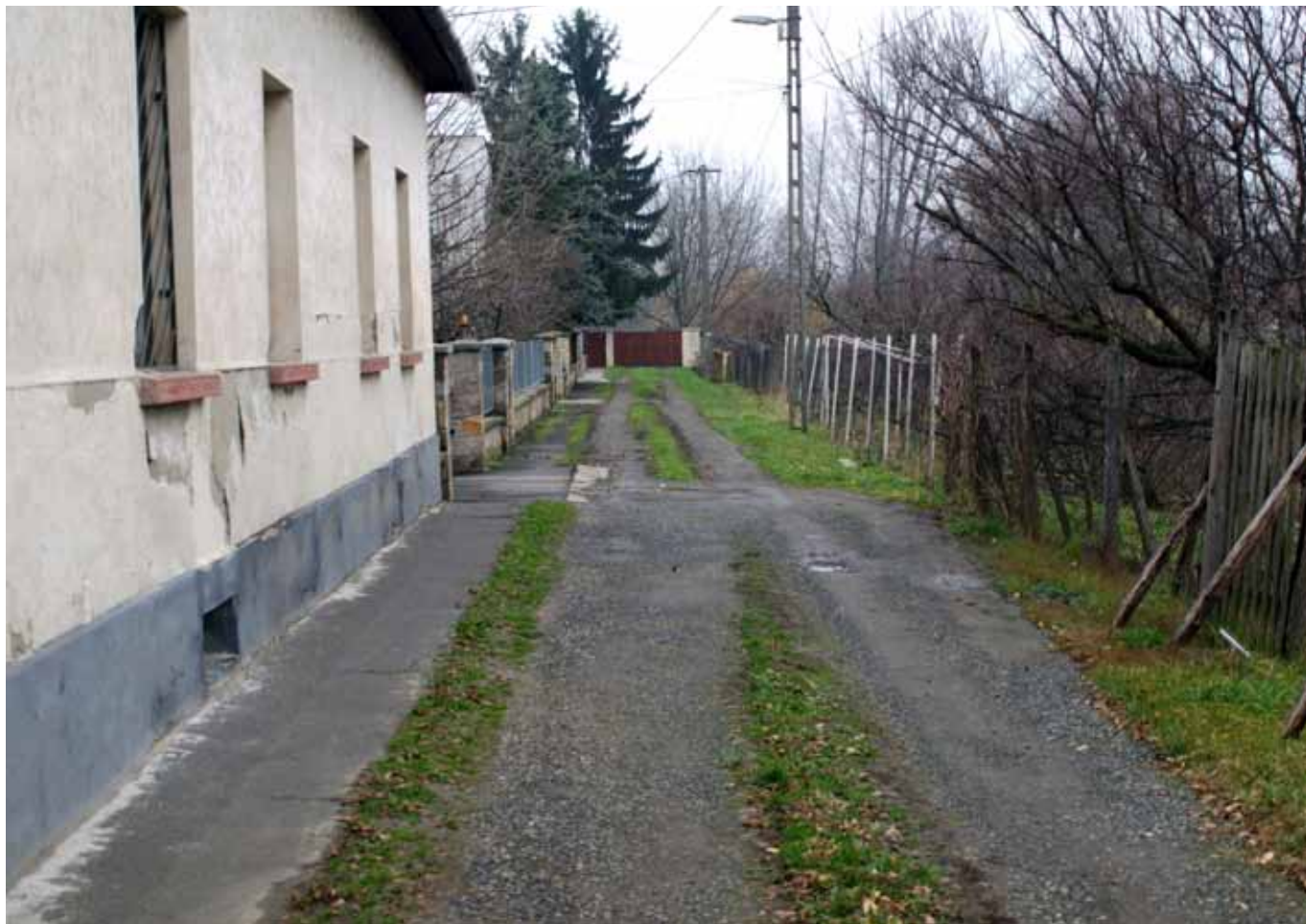
A Fábián utca egyik szakaszán tavasszal újulhat meg a járda.