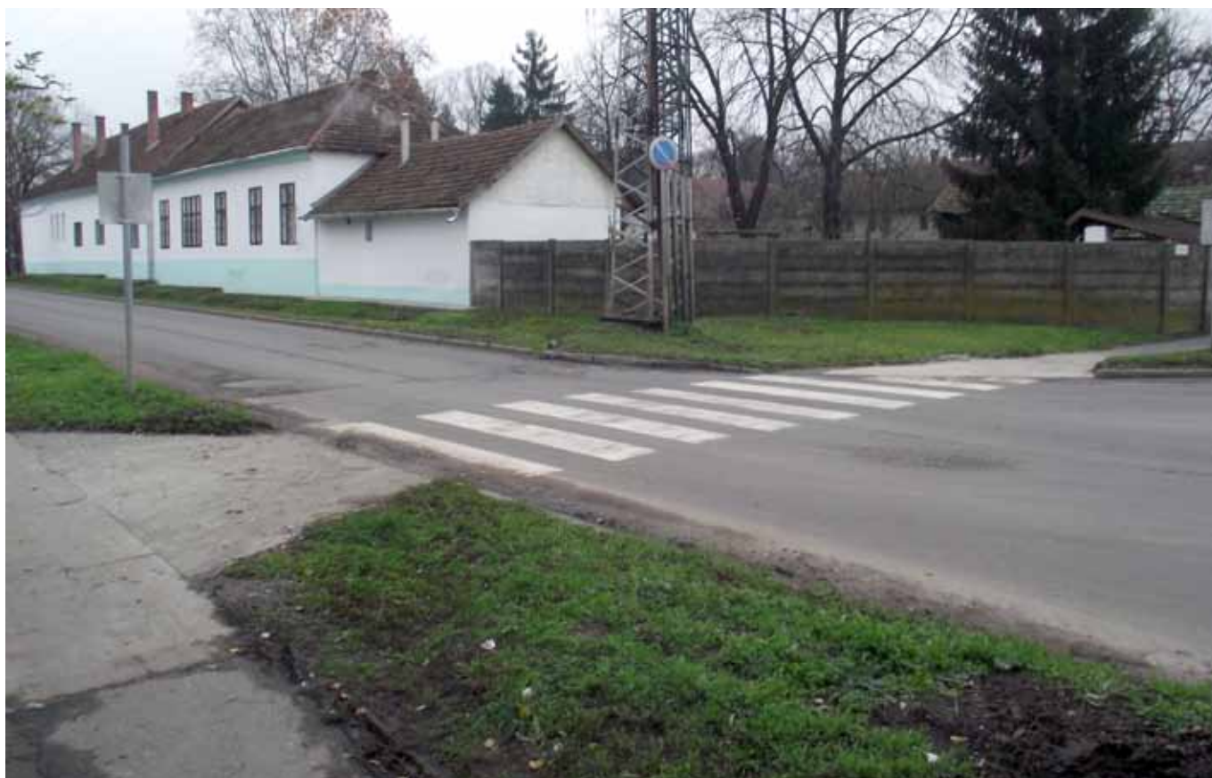
A választók régóta jelezték, hogy a Móricz Zsigmond és a Csíkos utca találkozásánál levő zebra mindkét oldalán a beton tönkrement, nagy a balesetveszély. Október végén ez a hiba is elhárult. Az új betonburkolaton már senkinek sem kell bukácsolnia.