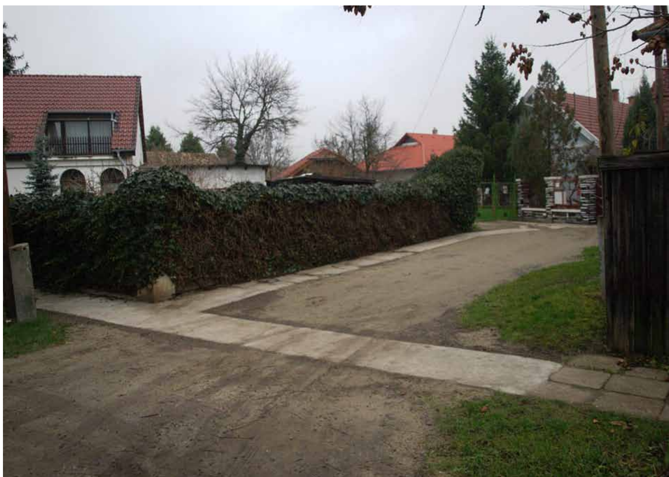
Az esti órákban a járókelőknek olyan sok bosszússágot okozó Kispince utcai járdaszakaszt a közmunkások teljesen felújították.