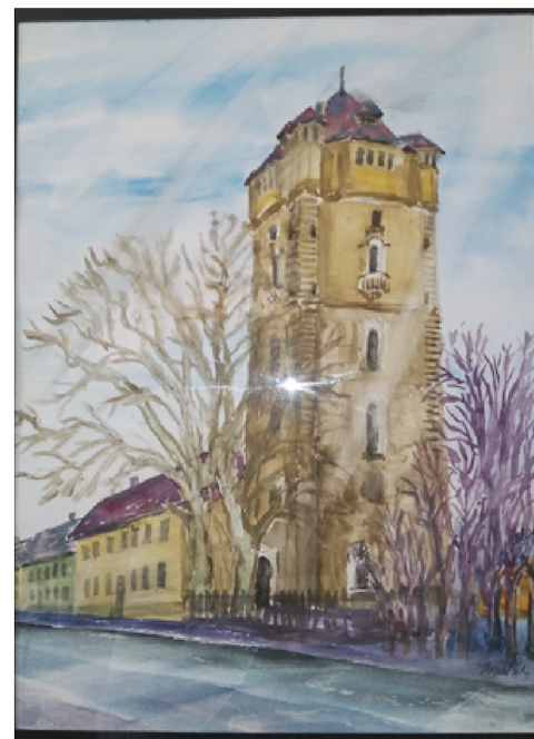
Brittich Erzsébett akvarellje az Arad-belvárosi templomról.

Erdőhegy-Kisjenőn se erdő, se hegy nem volt, csak fentről áradó szeretet.