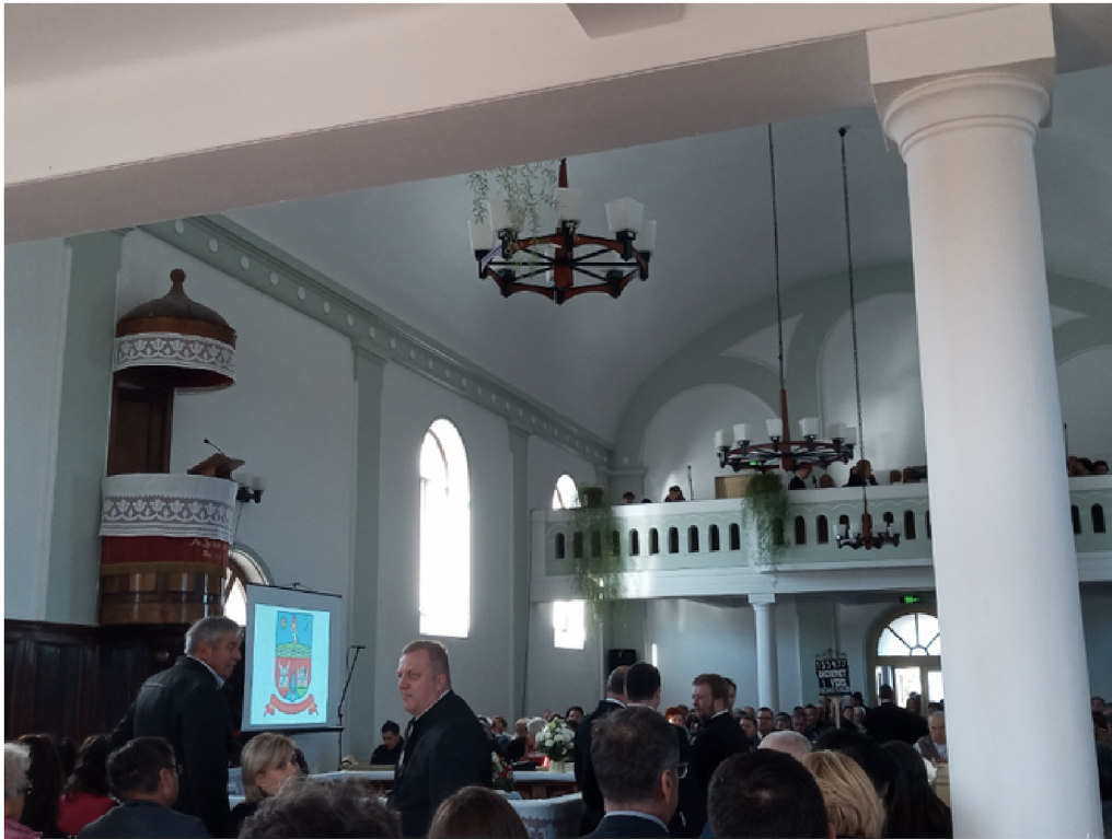
Gyülekező az erdőhegy-kisjenői templomban 2023. október 7-én

„Magyar reformátusok sokan vagyunk, és elég erősek ahhoz, hogy megmaradjunk.”